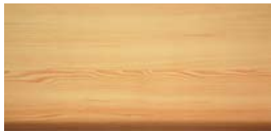
Best.-Nr. 54, Kiefer