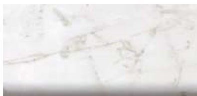
Best.-Nr. 65, Marmor Bianco