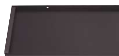
Best.-Nr. 7016M, Anthrazitgrau Matt