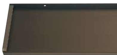
Best.-Nr. C33, Mittelbronze