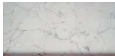
Best.-Nr. 68, Roma