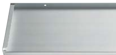
Best.-Nr. C0, Natur eloxiert