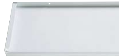
Best.-Nr. 9016, Weiß