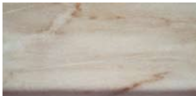
Best.-Nr. 61, Marmor