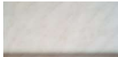
Best.-Nr. 62, Carrara