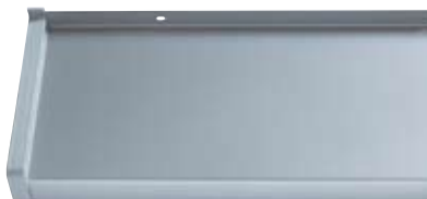
Best.-Nr. 701, Silber