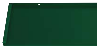
Best.-Nr. 6005M, Moosgrün Matt