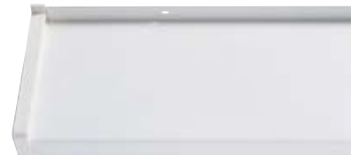
Best.-Nr. 703, Weiß