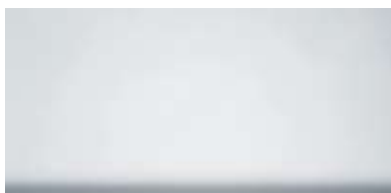
Best.-Nr. 66, Weiß